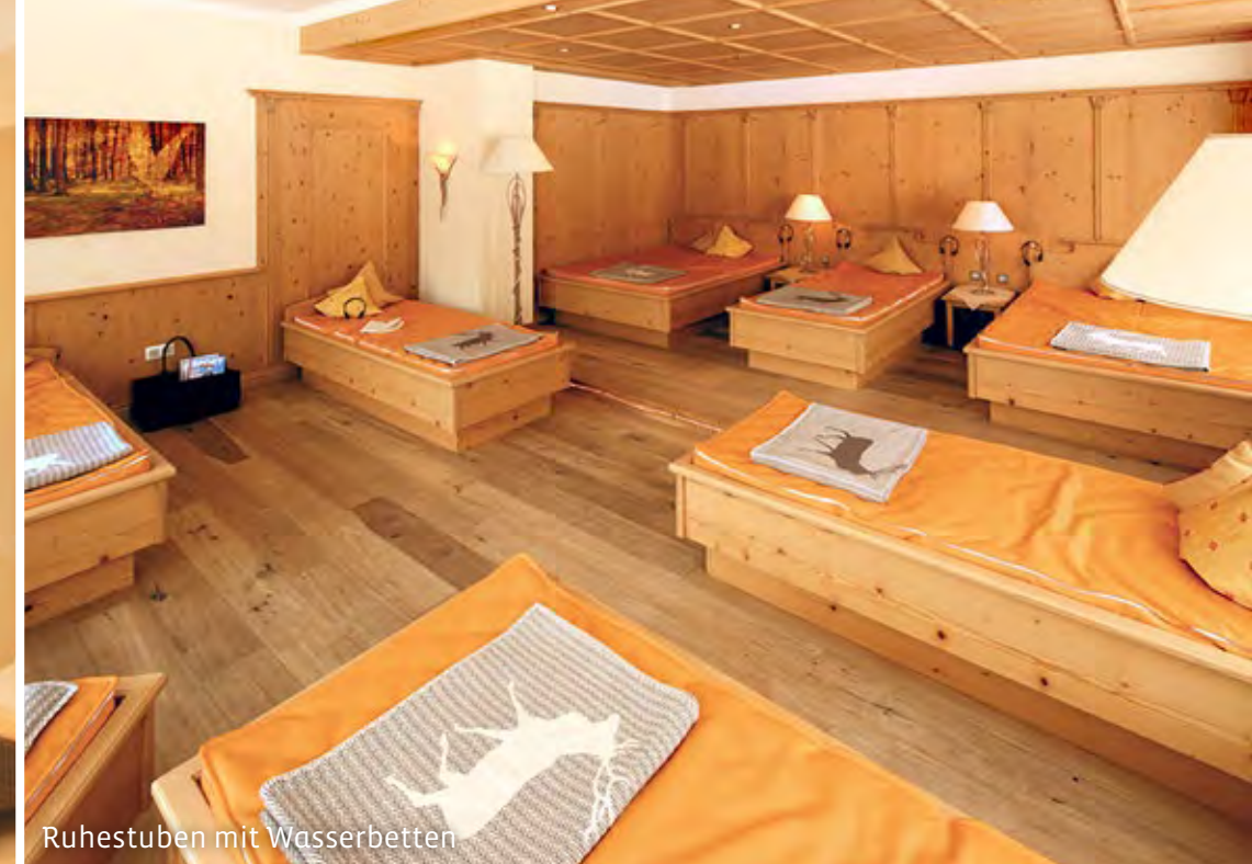
Ruhestuben mit Wasserbetten