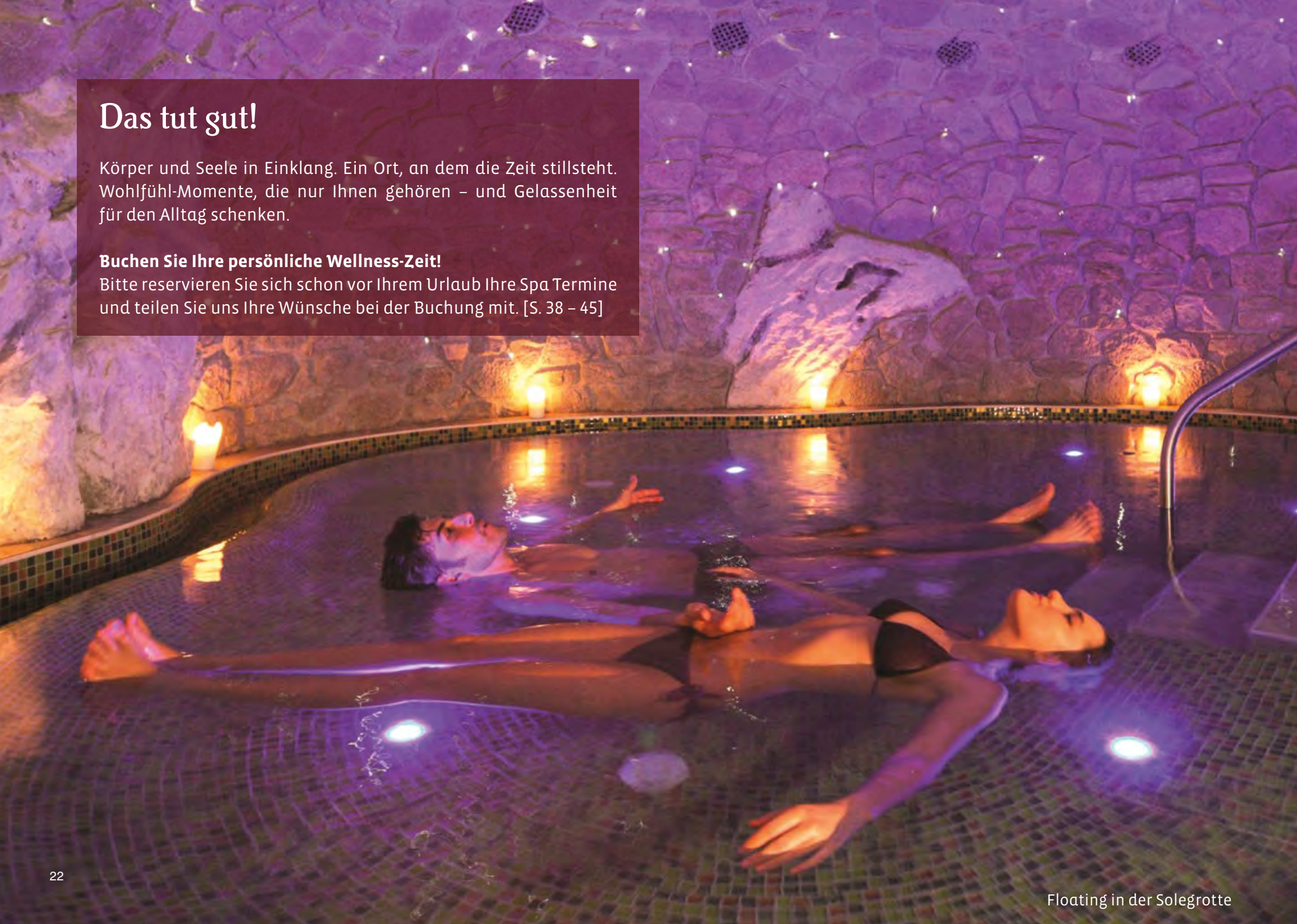
Floating in der Solegrotte

Bitte reservieren Sie sich schon vor Ihrem Urlaub Ihre Spa Termine und teilen Sie uns Ihre Wünsche bei der Buchung mit. [S. 38 – 45]