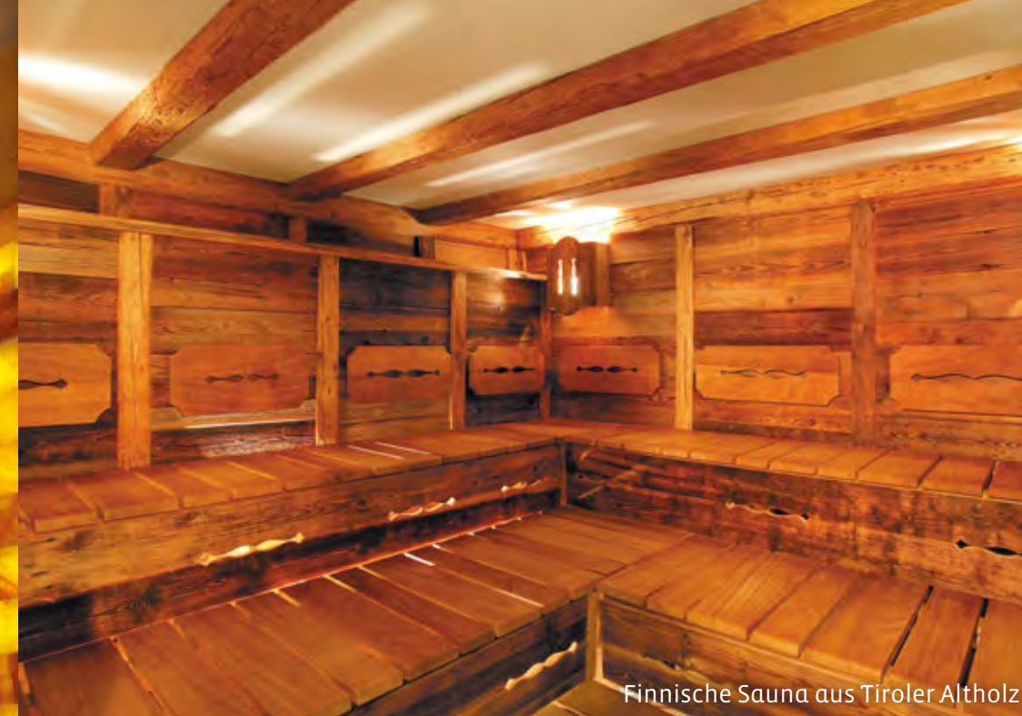
Finnische Sauna aus Tiroler Altholz