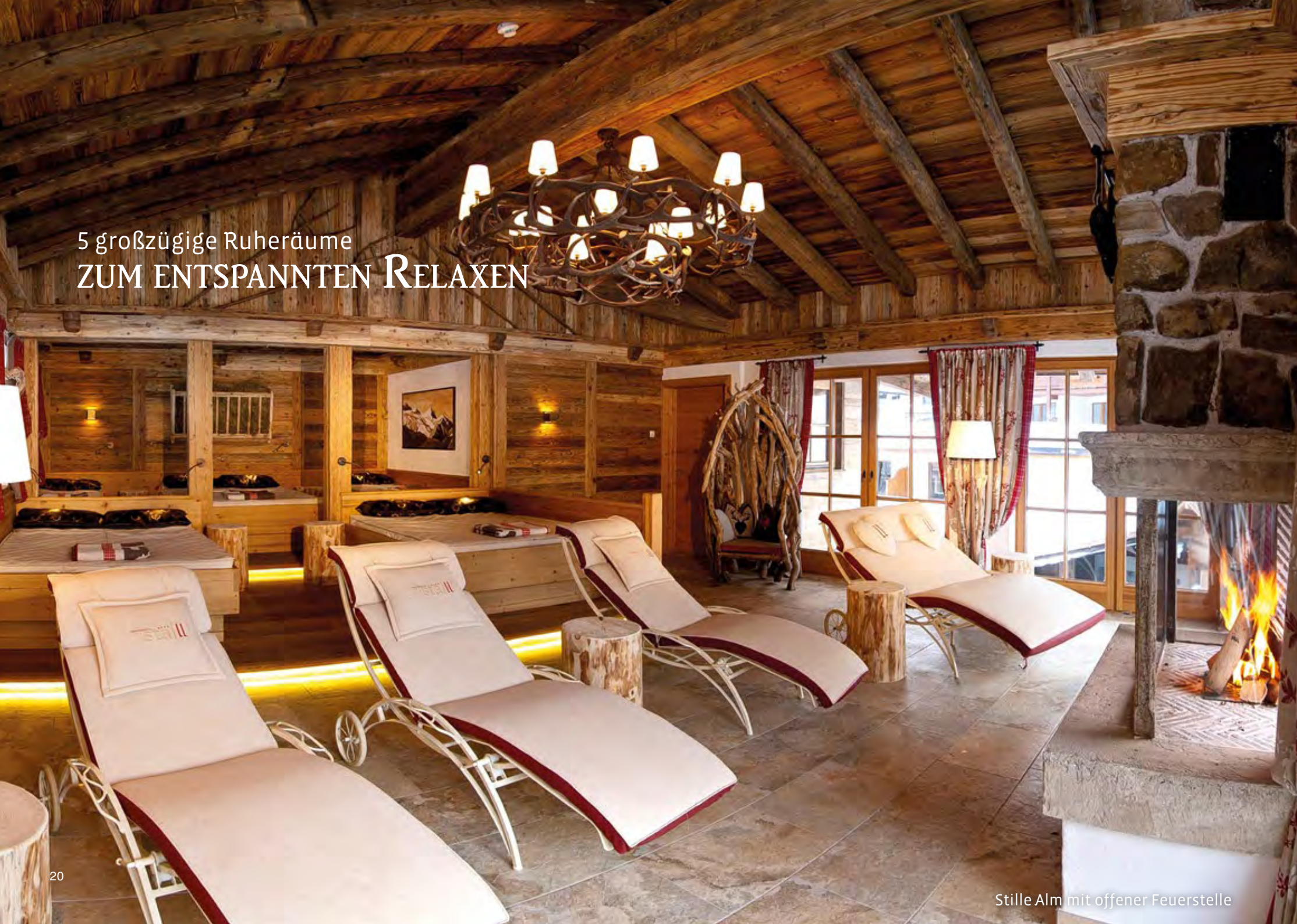
Stille Alm mit offener Feuerstelle

5 großzügige Ruheräume ZUM ENTSPANNTEN RELAXEN