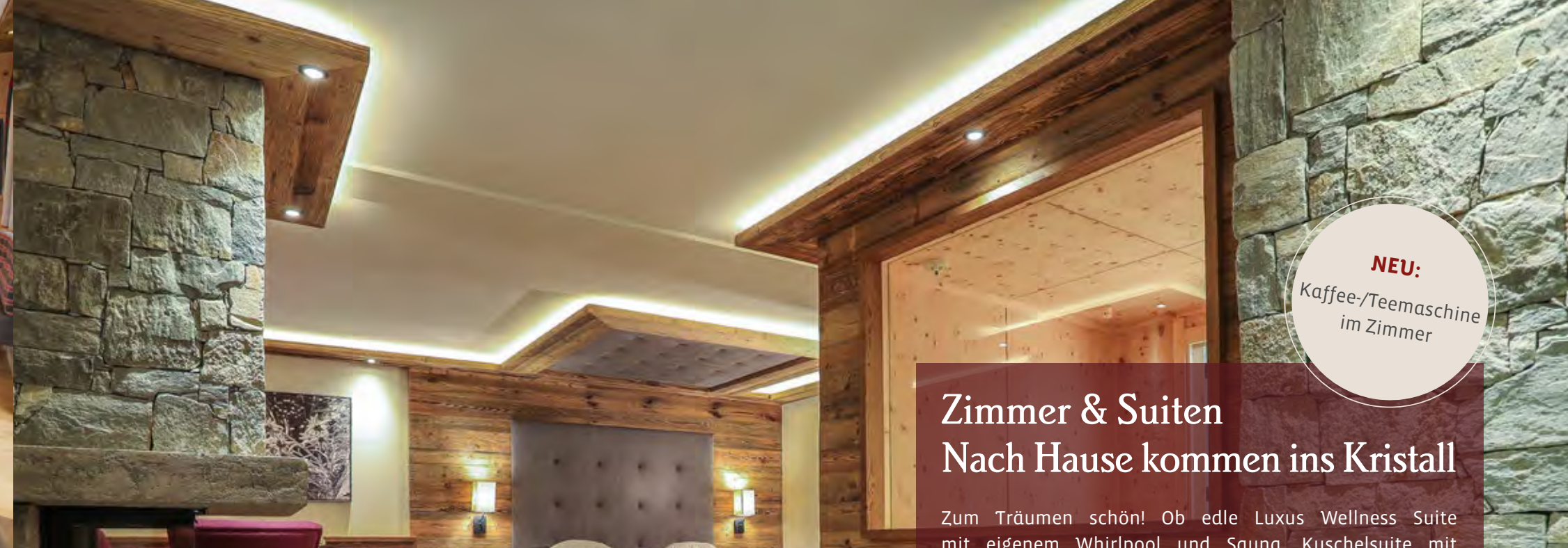
Luxus Wellness Suite