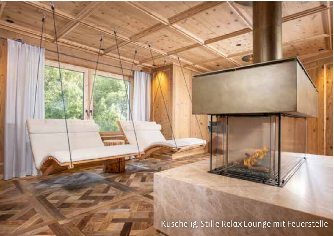
Kuschelig: Stille Relax Lounge mit Feuerstelle