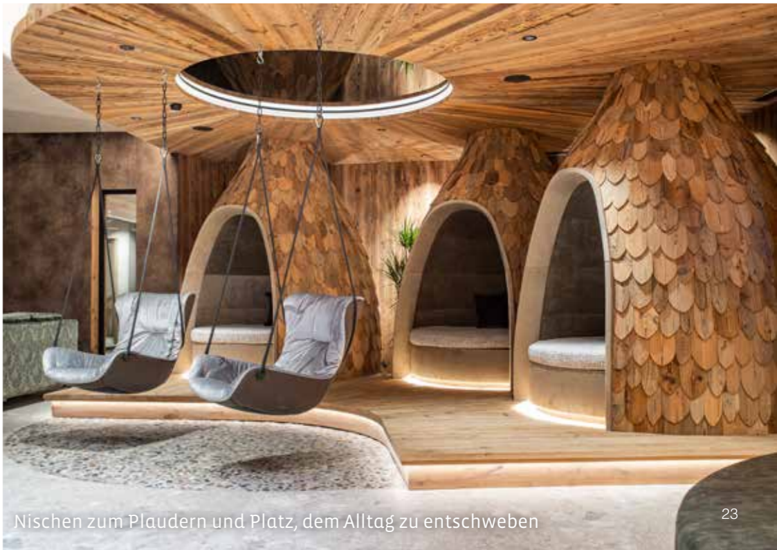
Nischen zum Plaudern und Platz, dem Alltag zu entschweben