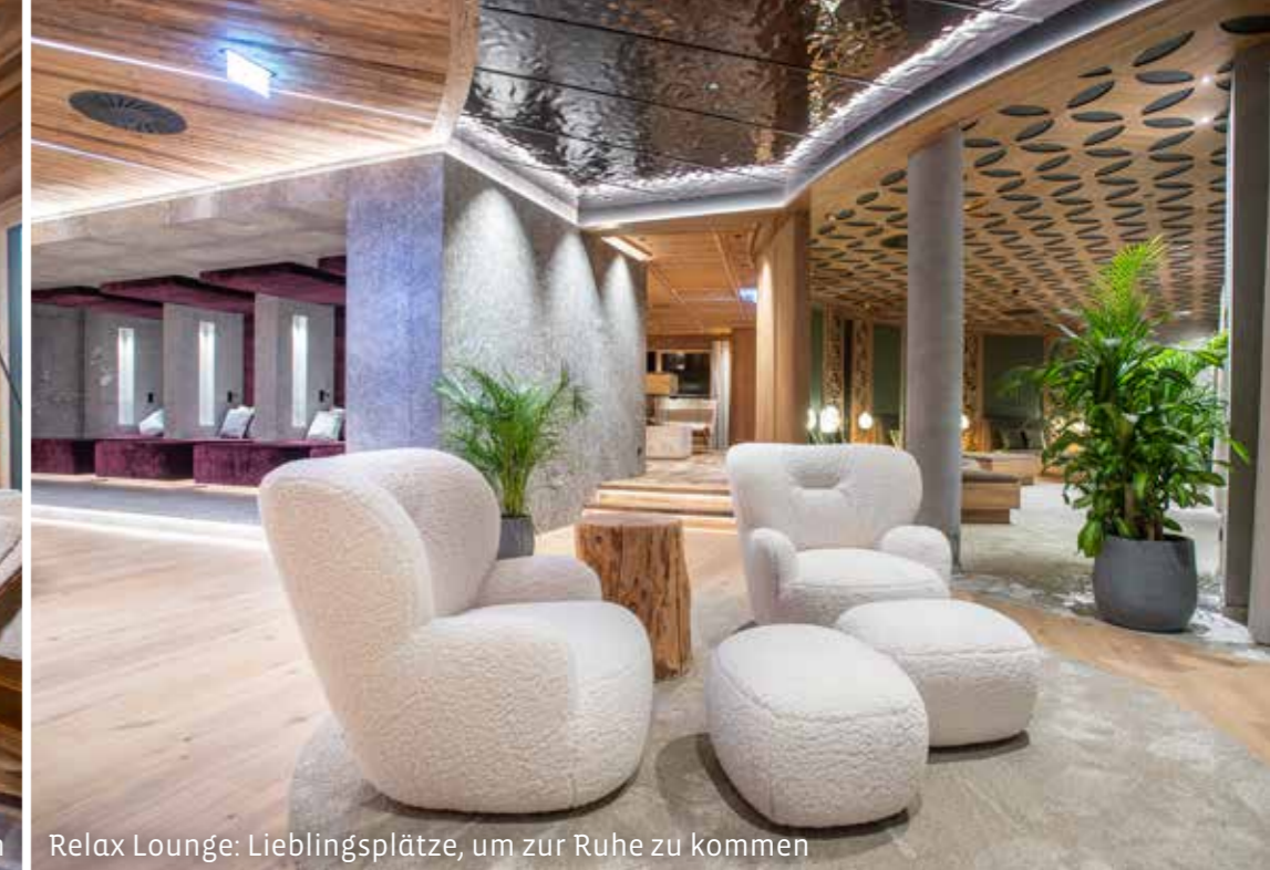
Relax Lounge: Lieblingsplätze, um zur Ruhe zu kommen