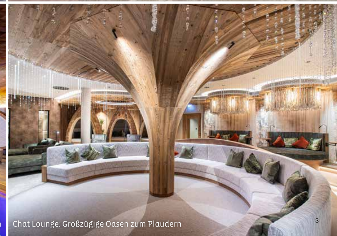
Chat Lounge: Großzügige Oasen zum Plaudern