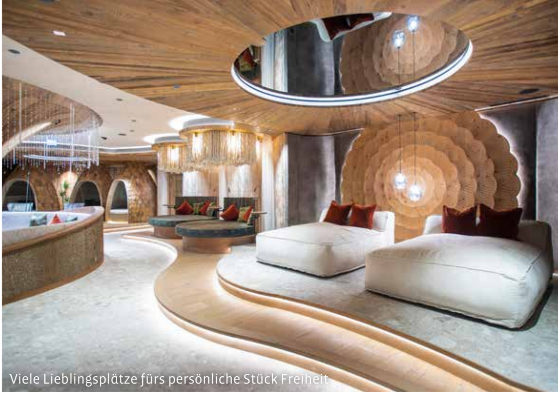
Viele Lieblingsplätze fürs persönliche Stück Freiheit