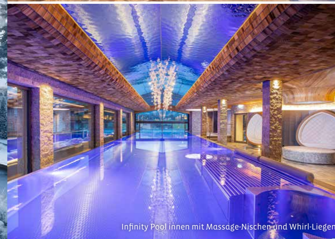
Infinity Pool innen mit Massage-Nischen und Whirl-Liegen