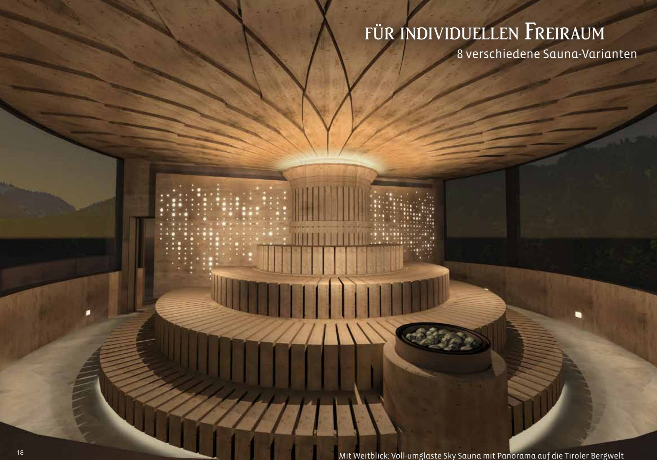
Mit Weitblick: Voll-umglaste Sky Sauna mit Panorama auf die Tiroler Bergwelt