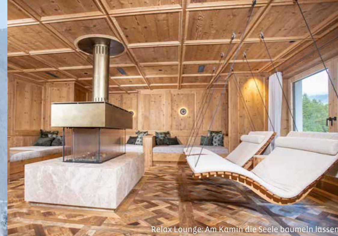
Relax Lounge: Am Kamin die Seele baumeln lassen