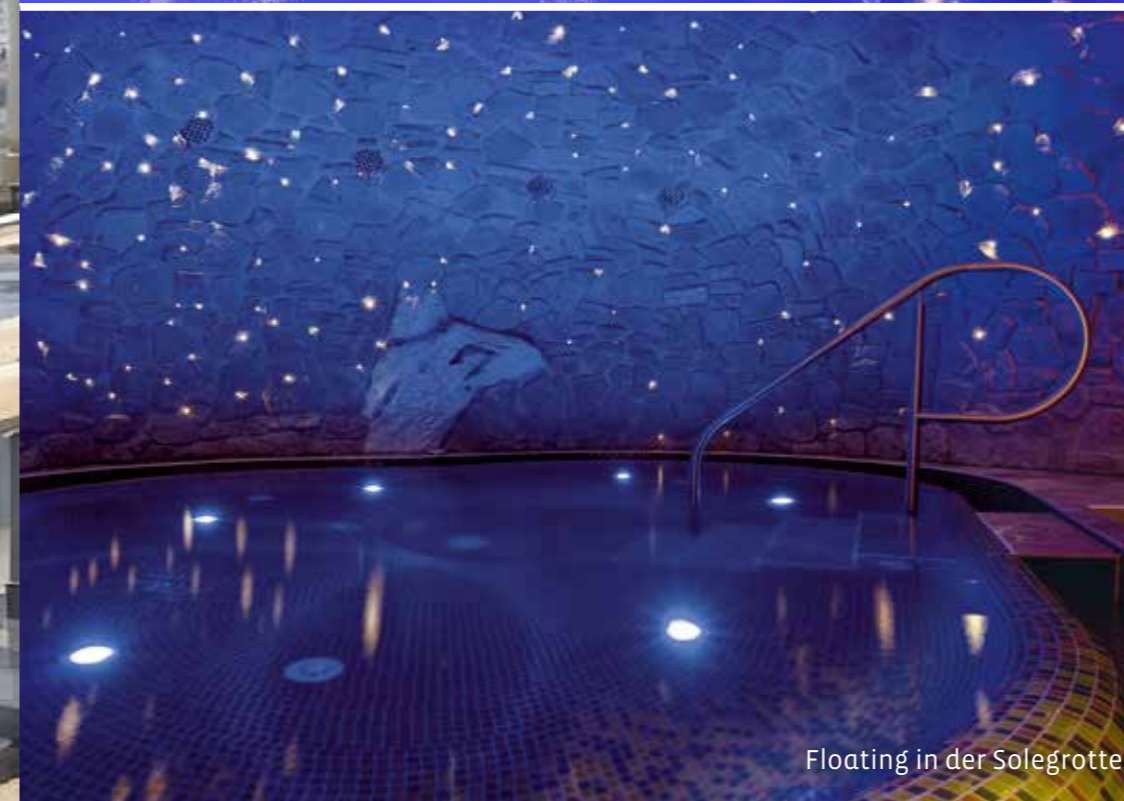
Floating in der Solegrotte