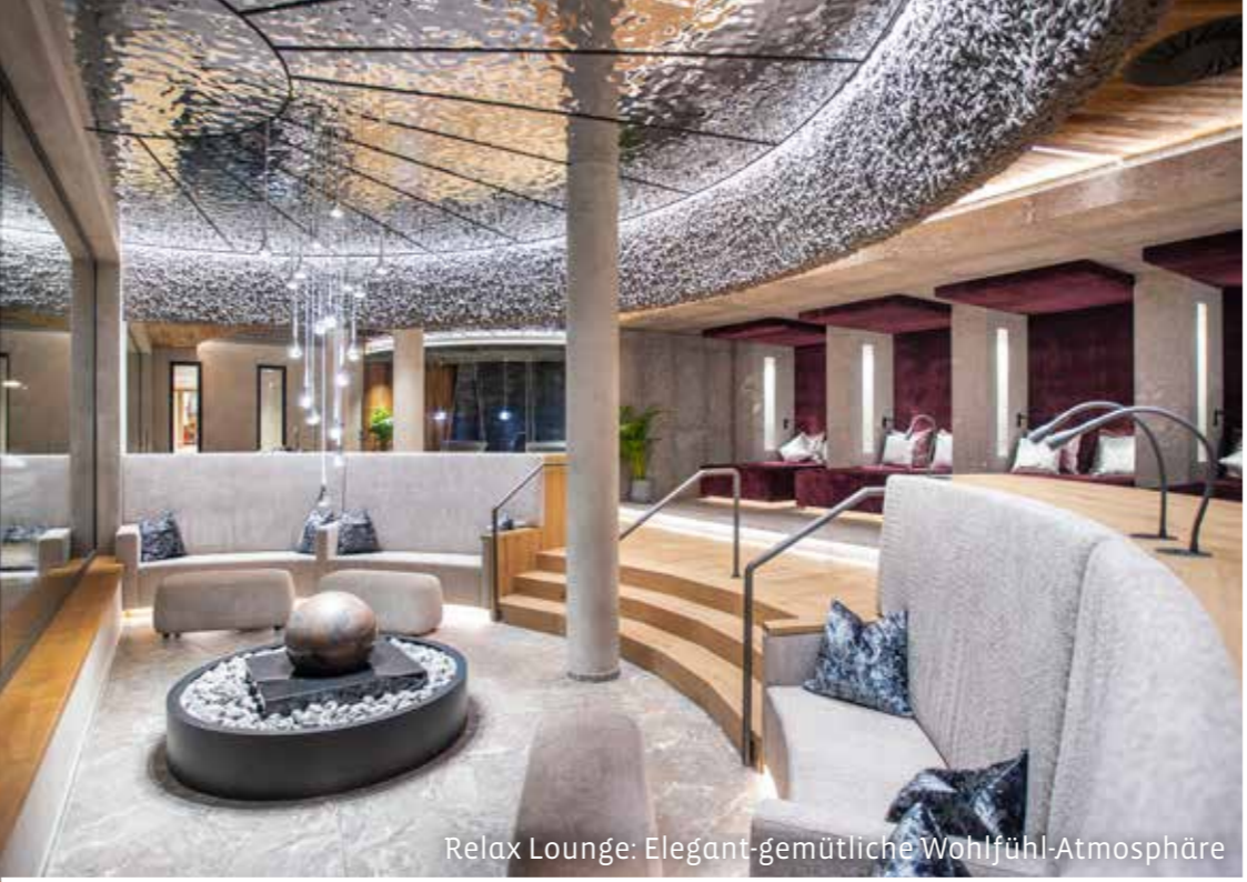
Relax Lounge: Elegant-gemütliche Wohlfühl-Atmosphäre